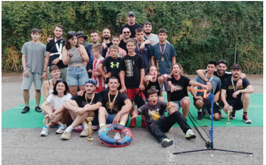
Αθλητές και παράγοντες του foot tennis

Ευχαριστούμε επίσης τον Παναγιώτη Τσιρογιάννη και τον Μάκη Κορδάτο για τις λήψεις των απονομών καθώς και για τις λήψεις με drone και κάμερα καθόλη τη διάρκεια του τουρνουά!!!