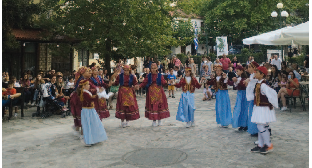
Το χορευτικό μας στην πλατεία

Κατά τη διάρκεια των χορών πραγματοποιήθηκε και λαχειοφόρος αγορά με αρκετά δώρα και η στήριξη του κόσμου για ακόμη μια φορά ήταν σημαντική. Το βράδυ μετά τις 11.30 πραγματοποιήθηκε το καθιερωμένο πάρτυ νεολαίας στο χώρο του Πνευματικού Κέντρου με dj και συγχωριανοί μας αλλά και άνθρωποι από άλλα χωριά ήρθαν, χόρεψαν και διασκέδασαν μέχρι τις πρώτες πρωινές ώρες.