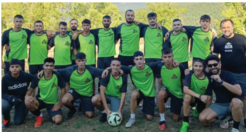
Η ποδοσφαιρική ομάδα του χωριού μας