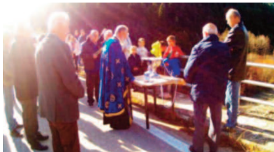
Από τον αγιασμό των υδάτων στη Γέφυρα.

Με καιρό ευνοϊκό πραγματοποιήθηκε και πάλι εφέτος ο αγιασμός των υδάτων στη Γέφυρα του Κρικελλοποτάμου την ημέρα των Θεοφανείων. Προηγήθηκε η θεία λειτουργία στον Καθεδρικό Ναό του χωριού μας, από τον εφημέριο της ενορίας π. Χριστοφόρο . Αρκετός κόσμος, μεταξύ των οποίων και κάτοικοι των Στάβλων, της Σκοπιάς, του