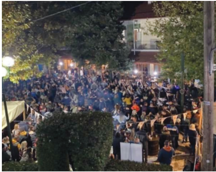
Η κατάμεστη πλατεία μας το θράδυ της 29ης Οκτωβρίου.

Στις 16.30 περίπου έφτασε ένα λεωφορείο από το ιδιωτικό πρακτορείο Alkyoni Travel Agency από το Καρπενήσι στο οποίο επέβαιναν ο Πολιτιστικός Σύλλογος «Παναγίας», ο Πεζοπορικός